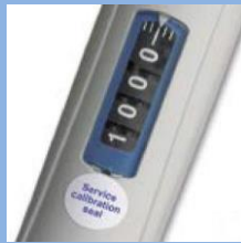
視認性に優れた大型目盛

キャップが自由に回転 キャップと分注容量調整つまみが別々に回転 分注操作中の設定容量ズレを防止