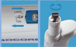
ユーザーキャリブレーション 分注容量の微調整も簡単操作