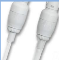
ワンプッシュチップイジェクター