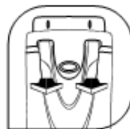
ポケットクリップを押し上げる