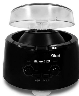
小型卓上遠心分離機